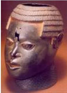
ESCULTURA DE IFE. 5000 a.C 3

alfarería y entierro de muertos en vasija; y la de Ife al encontrarse esculturas en latón.