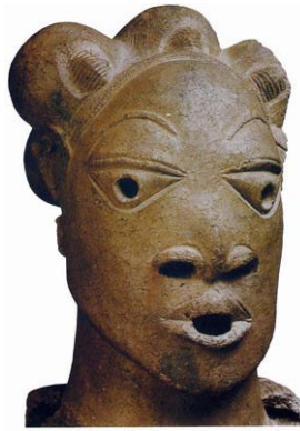
ESCULTURA DE NOK